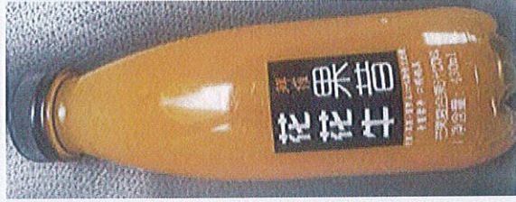
花花牛芒果果昔复合果汁饮料