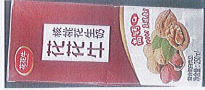
花花牛核桃花生奶植物蛋白饮品