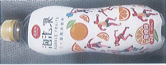
花花牛蜜桃味气泡水饮料