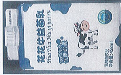
花花牛益生菌乳酸菌饮品