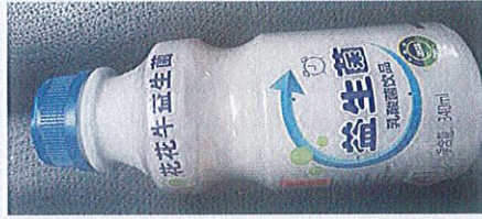
花花牛益生菌乳酸菌饮品