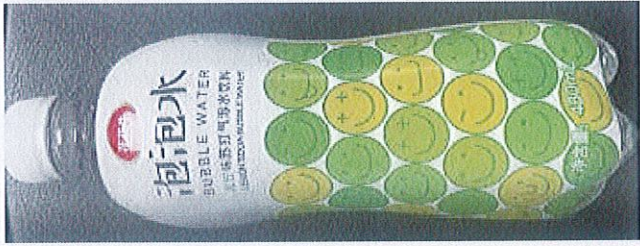
花花牛青柠味苏打气泡水