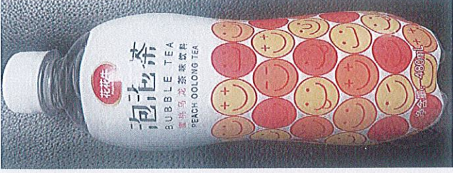
花花牛蜜桃乌龙茶味饮料