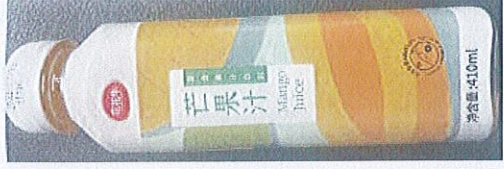
花花牛芒果汁复合果汁饮料