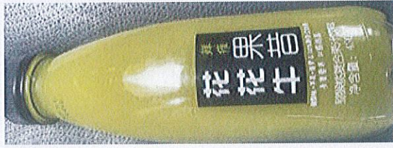
花花牛猕猴桃果昔复合果汁饮料