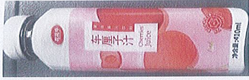
花花牛车厘子复合果汁饮料