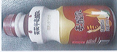
花花牛益生菌乳酸菌饮品